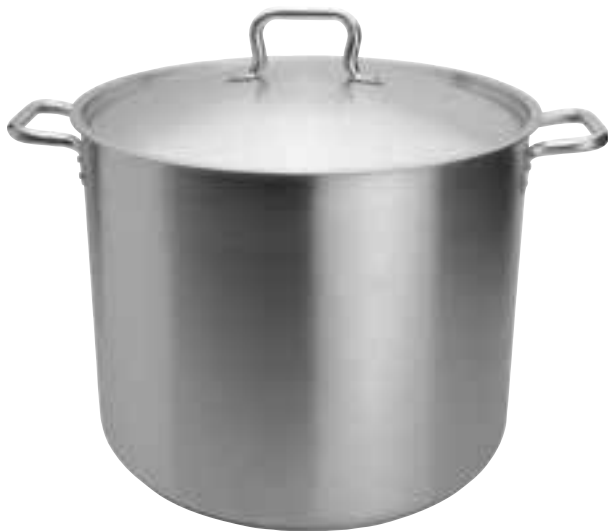
Stock Pot Includes cover.