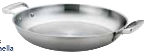
Paella Pans Poêles à paella