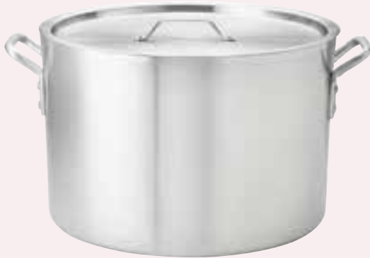
Heavy Weight Sauce Pots 6.0 mm / 2 Gauge.