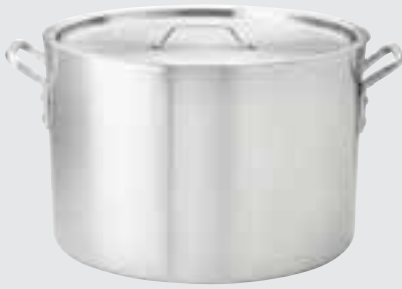
Standard Weight Sauce Pots 4.0 mm / 6 Gauge.