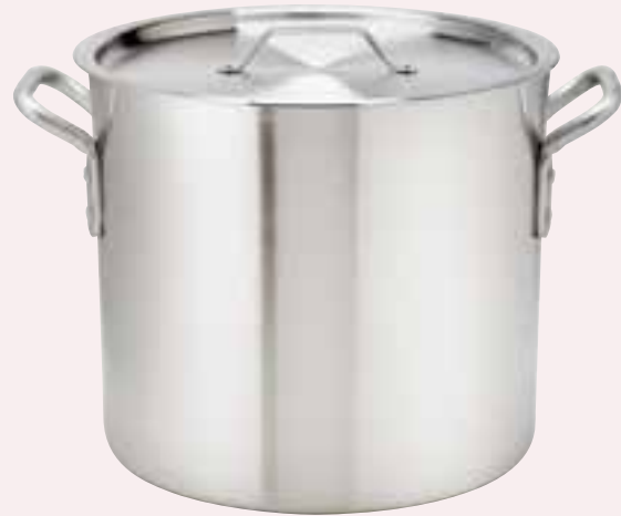
Heavy Weight Stock Pots 6.0 mm / 2 Gauge.