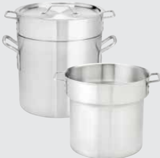
Standard Weight Double Boiler Sets Cover and insert included.