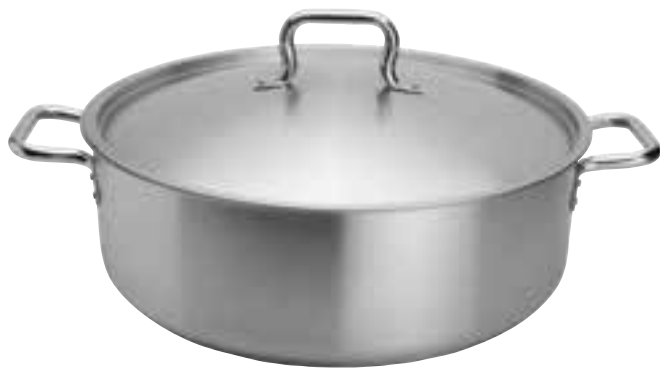
Brazier Includes cover.