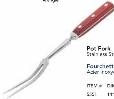
Pot Fork Stainless Steel. Forged blade.

Fourchette à viande Acier inoxydable. Lame forgée.