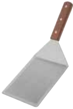
Stainless Steel Solid Turner Stiff. 13" / 33 cm overall length.

Pelle pleine en acier inoxydable Rigide. Longueur totale de 13 po / 33 cm.