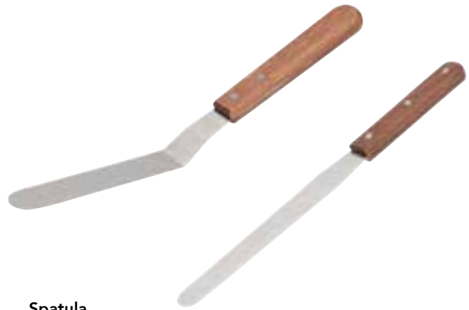
Spatula 18/8 Stainless steel blade.

Spatules Lame en acier inoxydable 18/ 8.