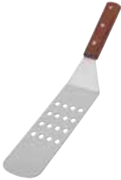
Turner Perforated. 14.5" / 36.8 cm overall length.

Pelle Perforée. Longueur totale de 14,5 po / 36,8 cm.