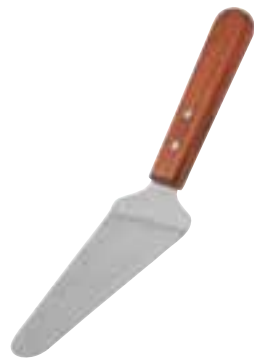
Pie Server Flexible. 10" / 25.4 cm overall length.

Pelle à tartes Flexible. Longueur totale de 10 po / 25,4 cm.