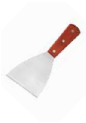
Grill Scraper Stiff.