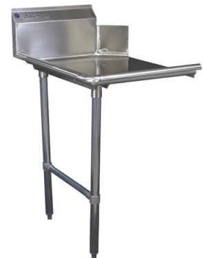
Table à vaisselle, propre – à gauche