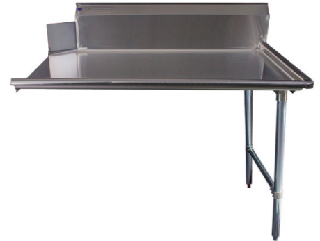
Table à vaisselle, propre – à droite